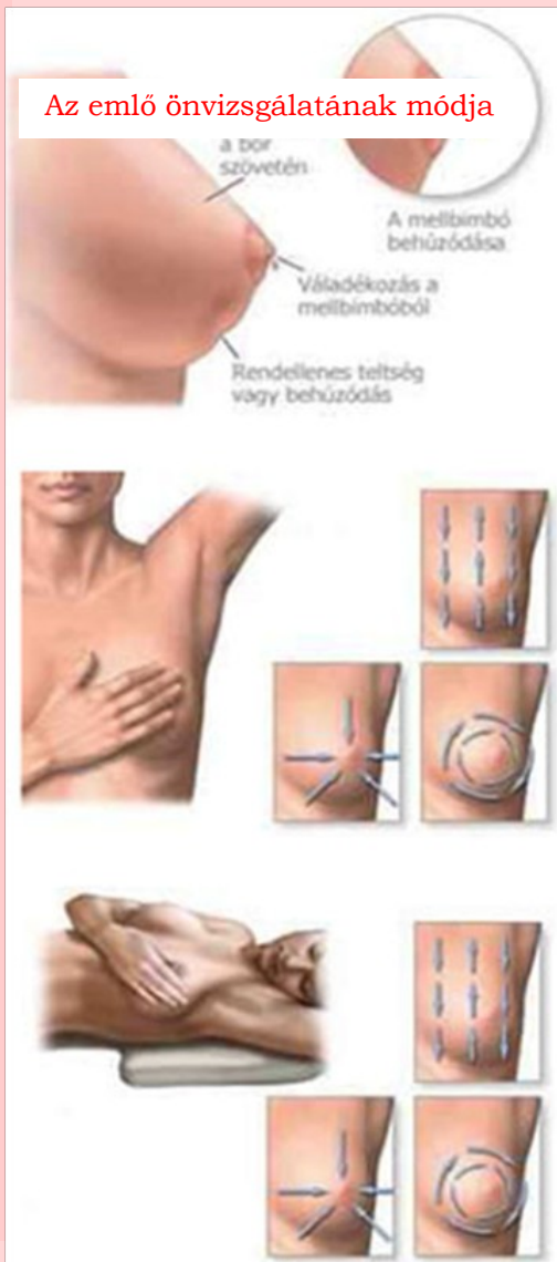
Az emlő önvizsgálatának módja

Ha a melle vagy a mellbimbóra gyakorolt enyhe nyomás hatására mellében megvastagodást, csomót, daganatot vagy köteges elváltozást tapint (amely az esetek döntő többségében fájdalmatlan! ), mellbimbójának, esetleg a mell bőrének behúzóadását, kisebenedését, megvastagodását véli felfedezni, ha mellbimbójából véres vagy savós váladék szivárog vagy mellét visszatérően fájdalmasnak, duzzadtnak érzi (menstruációtól függetlenül) haladéktalanul forduljon orvoshoz!