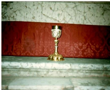
Miséző kehely /Barokk/