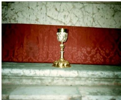
Miséző kehely /Barokk/