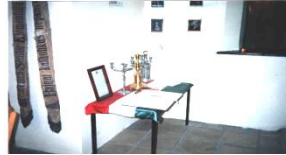
Kiállítás a templomban