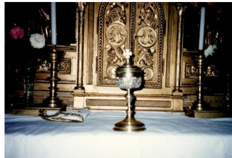
Áldoztató kehely /Barokk/

Van egy olyan áldoztató kehely is, amely a 34. Eukarisztikus Kongresszus és Szent István jubileumi év emlékére készült 1938-ban.