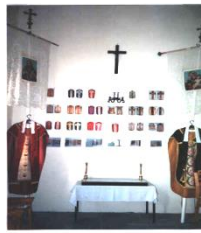
A kiállítás, amely az Urak házában van.